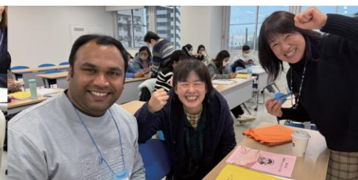
なかま 仲間ができる