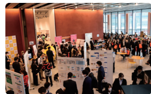
2023全国大会(茨城県開催)の様子。

日本介護福祉士会と都道府県介護福祉士会が連携して、国民のニーズに応えた介護・福祉の充実や質の向上のため、活動しています。各種研修や全国大会の開催など、皆さんとより近い距離で活動しています。